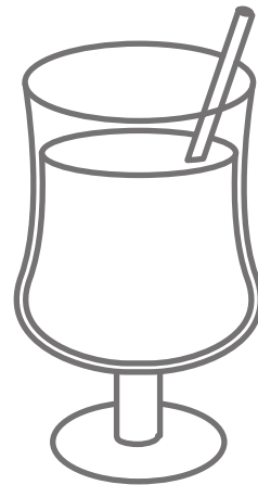
ジュース Juice (ジュース)