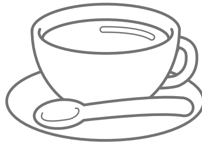
こうちゃ Tea (ティー)