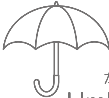
かさ Umbrella (アンブレラ)