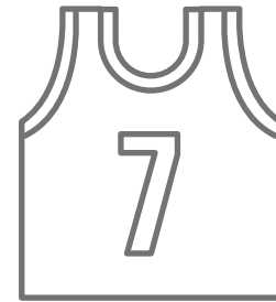
ユニフォーム Uniform (ユニフォーム)